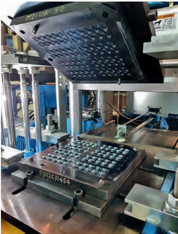
Bild 3: Compression Moulding erlaubt den einfachen Übergang vom Prototyping in die Großserie

Es hat sich in der Praxis gezeigt, dass erst eine Vollkostenrechnung eine wirkliche Beurteilung der Wirtschaftlichkeit erlaubt.