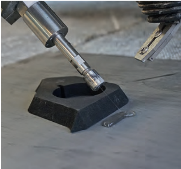
Bild 1: Die Wasserstrahlschneidetechnik bietet sich heute für die Fertigung vieler Dichtungs- und Formteillösungen an